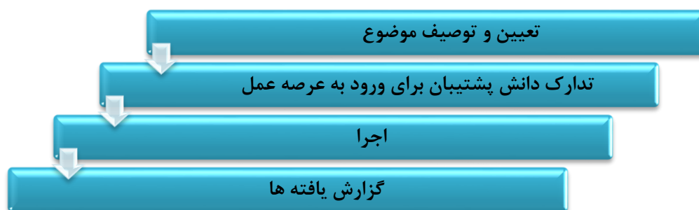
شکل شماره ۲: چرخه درس آموزش پژوهی در عرصه عمل

چرخه آموزش پژوهی ناظر به فرایند عمل و تأمل بر آن که مراحل آن در شکل شماره ۲، نشان داده شده است: