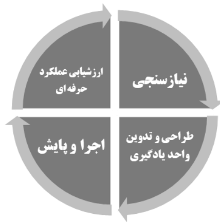
شکل شماره ۴: چرخه فعالیت کارآموزی

این فرایند شامل چهار مرحله است که عبارتند از: «نیازسنجی»، «طراحی و تدوین واحدهای یادگیری»، «اجرا و پایش» و «ارزشیابی عملکرد حرفه ای». شکل شماره ۴، چرخه فرایند کارآموزی را نشان می دهد: